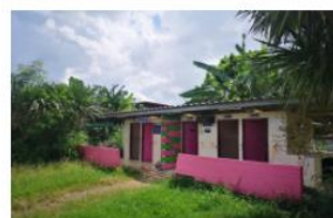
ส้วม อื่น อื่น ปีที่สร้าง 2548