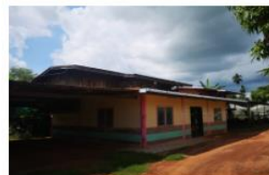
บ้านพักครู องค์การฯ ปีที่สร้าง 2518