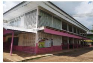
อาคารเรียน สปข.101/26 ปีที่สร้าง 2525