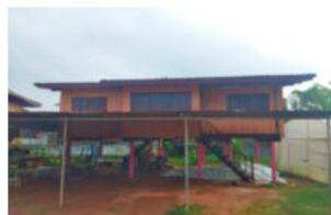
บ้านพักครู องค์การฯ ปีที่สร้าง 2515