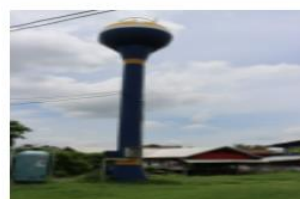
ถังเก็บน้ำ หอส่งน้ำ(ประปา ส.ส.) ปีที่สร้าง 2561