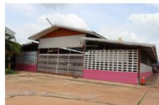
อาคารอเนกประสงค์/โรง อาหาร/โรงฝึกงาน/หอ ประชุม โรงอาหาร 260 ที่นั่ง ปีที่สร้าง 2515