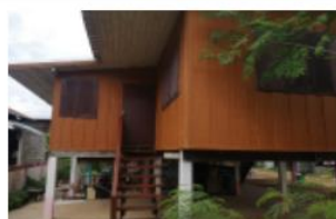
บ้านพักครู องค์การฯ ปีที่สร้าง 2521