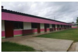
อาคารเรียน กิ่งถาวร ปีที่สร้าง 2558