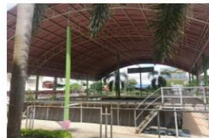
อาคารอเนกประสงค์/โรง อาหาร/โรงฝึกงาน/หอ ประชุม อื่น อื่น(สร้างเอง) ปีที่สร้าง 2560