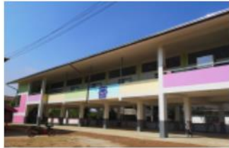
อาคารเรียน สปข. 105/29 2 ชั้น 4 ห้อง ใต้ถุนโล่ง ปีที่สร้าง 2562