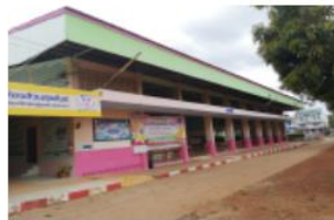
อาคารอเนกประสงค์/โรง อาหาร/โรงฝึกงาน/หอ ประชุม สปข.206/26 ปีที่สร้าง 2528