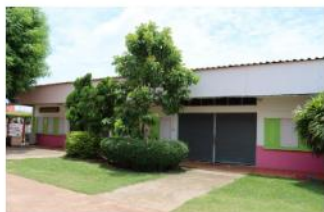
อาคารอเนกประสงค์/โรง อาหาร/โรงฝึกงาน/หอ ประชุม สปข.203/26 ปีที่สร้าง 2526