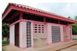
ส้วม ส้วมนักเรียนหญิง 6 ที่/49 ปีที่สร้าง 2563