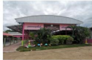
อาคารอเนกประสงค์/โรง อาหาร/โรงฝึกงาน/หอ ประชุม อื่น อื่น(สร้างเอง) ปีที่สร้าง 2560