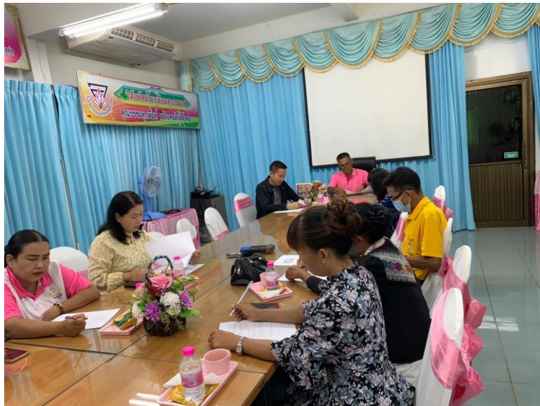
ภาพประกอบ มติที่ประชุมในการพิจารณาคัดเลือกหนังสือเรียนและแบบฝึกหัดตามนโยบายเรียนฟรี ๑๕ ปี อย่างมีคุณภาพปีการศึกษา ๒๕๖๗