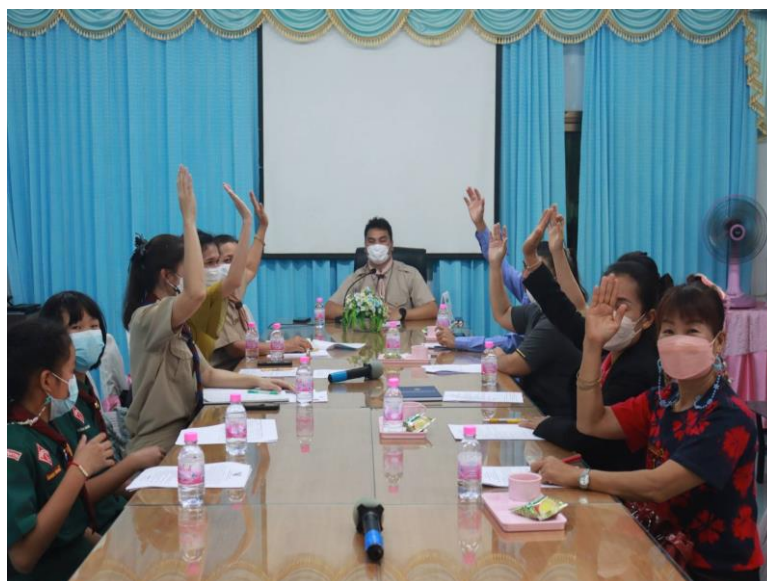
ภาพประกอบ คณะกรรมการภาคี 4 ยกมือเห็นชอบตามมติที่ประชุมในการพิจารณาคัดเลือกหนังสือเรียน และแบบฝึกหัดตามนโยบายเรียนฟรี 15 ปีอย่างมีคุณภาพปีการศึกษา 2566