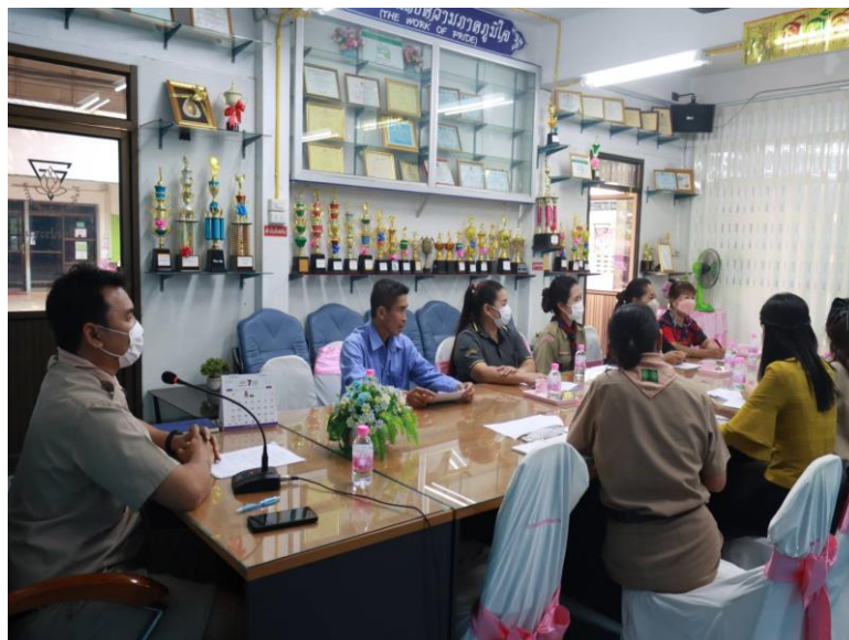
ภาพประกอบ คณะกรรมการภาคี 4 ฝ่ายร่วมประชุมหารือฝ่ายเพื่อพิจารณาคัดเลือกหนังสือเรียนและแบบฝึกหัดตามนโยบายเรียนฟรี 15 ปีอย่างมีคุณภาพปีการศึกษา 2566